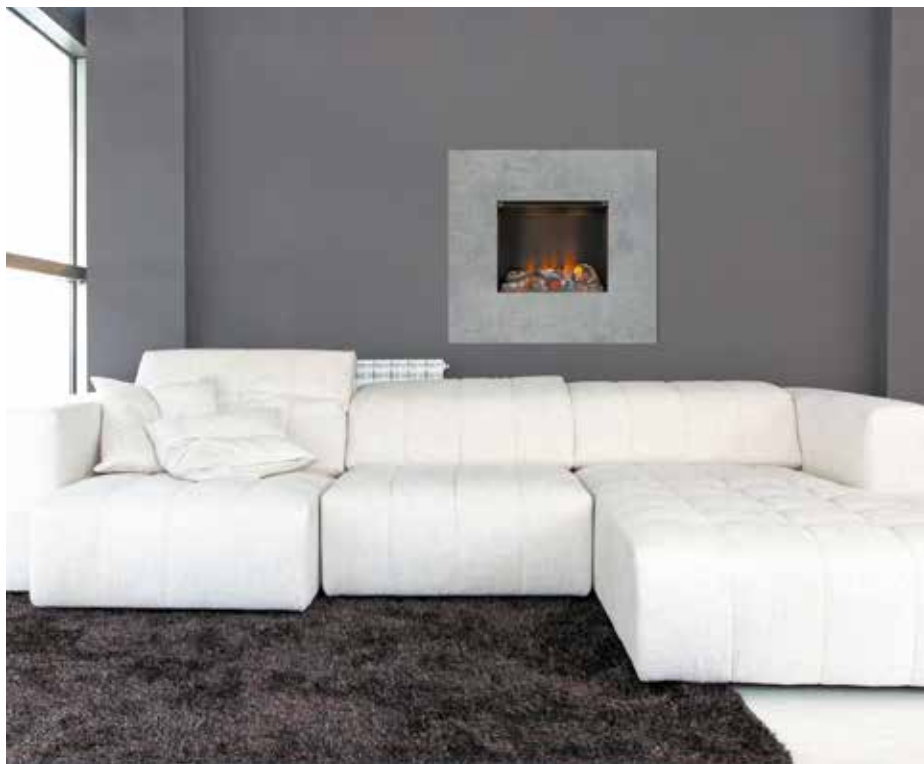
Wall fire engine S