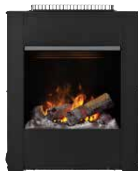
Wall fire engine L