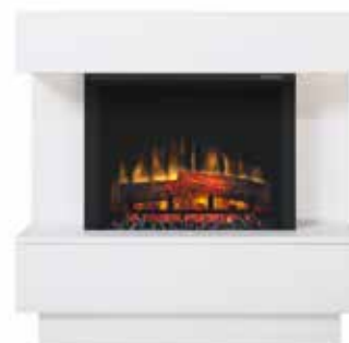
Avalone White Optiflame®