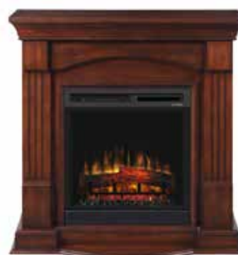
Campana XHD23 Optiflame®