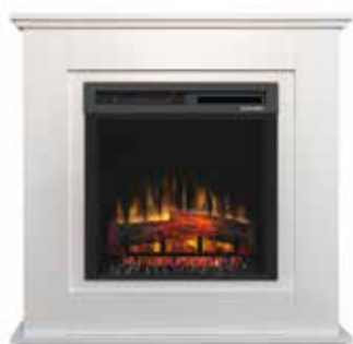
Asti White Optiflame®